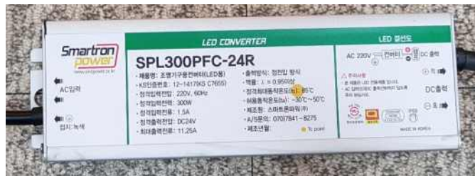
그림 1. 시료 사진